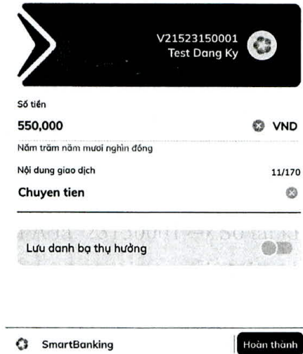
Hình 8: Giao diện xác nhận giao dịch

Bước 4.5: Nhập nội dung thanh toán: MÃ THÍ SINH_HỌ VÀ TÊN THÍ SINH